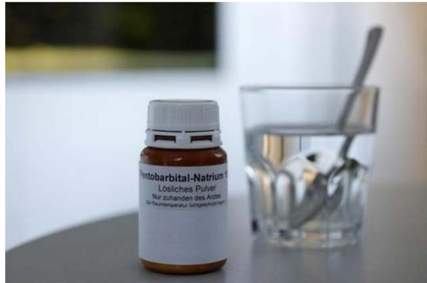
Tödliche Dosis: 15 Gramm Pentobarbital-Natrium, aufgenommen 2008 bei Exit Schweiz.