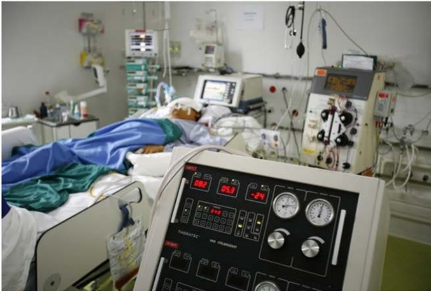
Wenn sie um Hilfe zum Suizid gebeten werden, ist das für Ärzte eine schwierige Entscheidung: Die Intensivstation am Spital Basel.